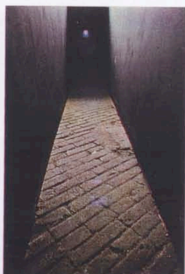
BETTINA MUNK, Hamburg - Spanien / Die Reise, 1988.